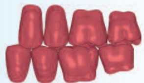
Montaje con una relación "diente a dos dientes"