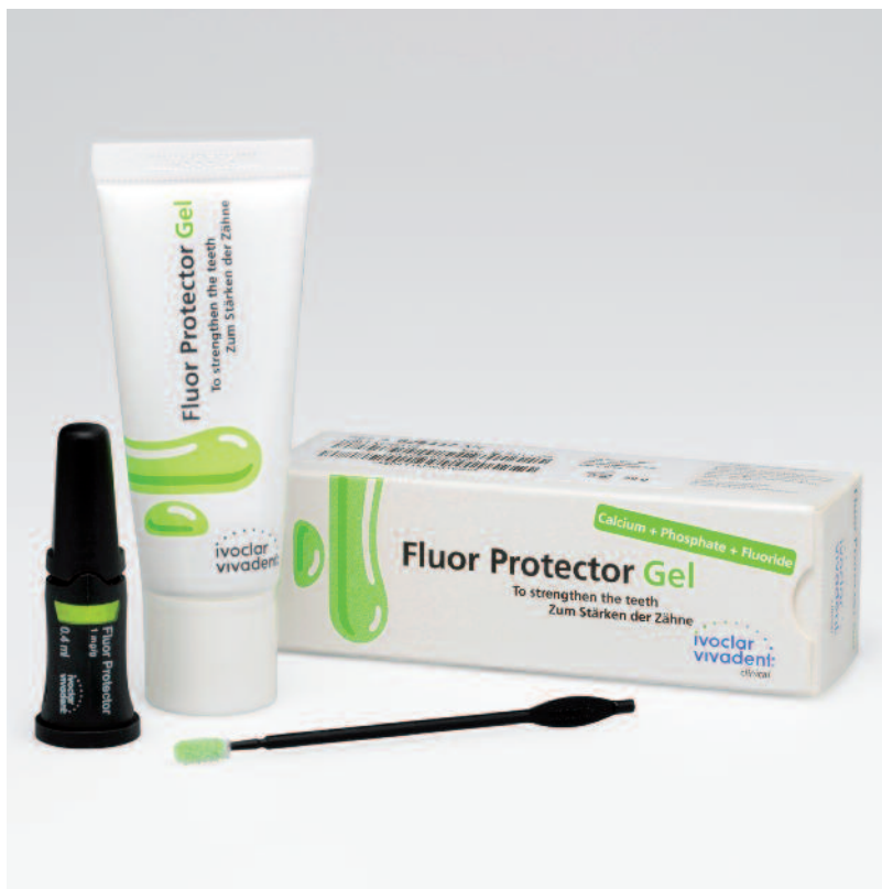
Un dúo potente: el barniz Fluor Protector en la nueva VivAmpoule y Fluor Protector Gel para cuidados especiales.

El agradable sabor a menta y la sensación de dientes lisos después del tratamiento con Fluor Protector Gel, dejan un buen sabor de boca.