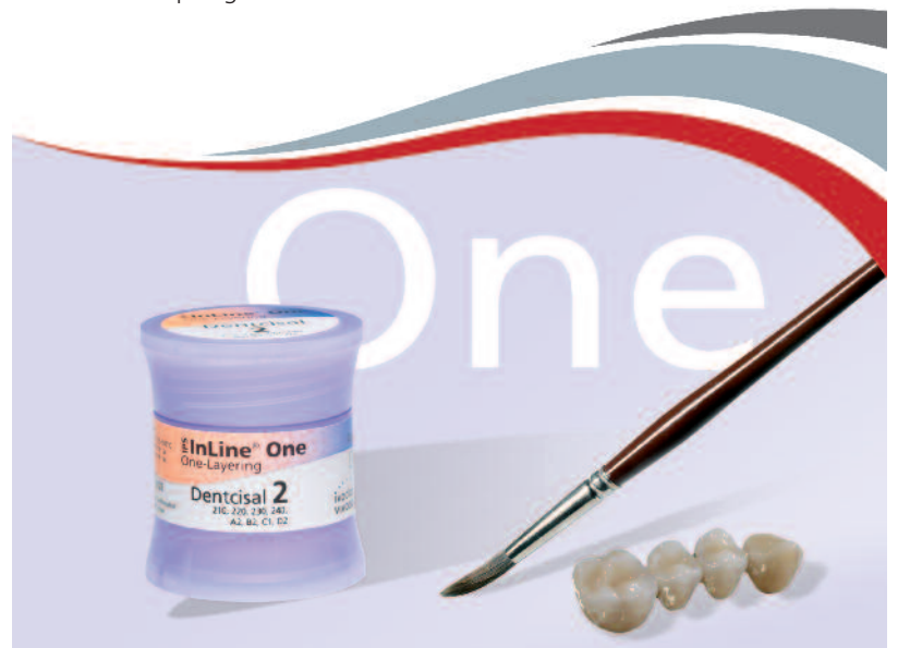
Con IPS InLine One la estratificación se hace en un único paso.

La base de cromo-cobalto permite optimizar además la rentabilidad de las restauraciones.