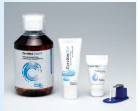
Los productos Cervitec mantienen los gérmenes a raya.

Los productos Cervitec facilitan el cuidado personal de los pacientes en la consulta y en casa.