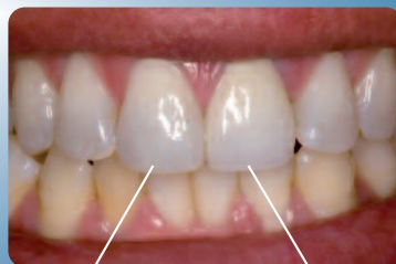
Carilla de composite IPS Empress Direct Corona cerámica IPS Empress Esthetic