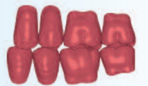
Montaje con una relación "diente a diente"

La configuración universal de la fosa central con los dientes inferiores SR PHONARES Lingual ofrece al usuario dos opciones de intercuspidadación: puede realizarse un montaje con una relación "diente a diente" o también con una relación "diente a dos dientes", lo que ofrece al protésico mayor flexibilidad y permite mantener un stock de dientes más reducido.