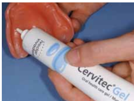
Un gel suave para el cuidado oral se utiliza para tratar estomatitis dental.