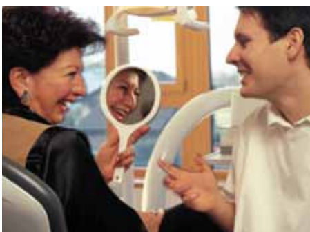
Una Buena sensación en la boca aumenta el sentido de bienestar en una persona.

Aparte de la experiencia práctica, están disponibles resultados de estudios, en los que se han utilizado los productos para tratar una variedad de problemas en los diferentes grupos de pacientes. Información sobre los beneficios particulares de los productos y sugerencias de aplicación para los diferentes grupos objetivo se proporcionan en la documentación promocional correspondiente.