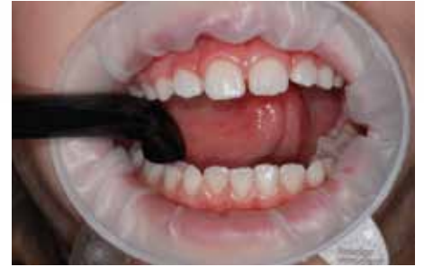
Suficiente espacio para Bluephase Style en la boca de un niño

Bluephase Style polimeriza todos los materiales de obturación y sellantes de fisuras disponibles en el mercado debido a su LED polywave®.