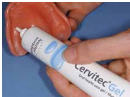
Utilisation d'un gel d'hygiène buccale dans le cadre du traitement d'une stomatite prothétique (photo : Dr A. Peschke).