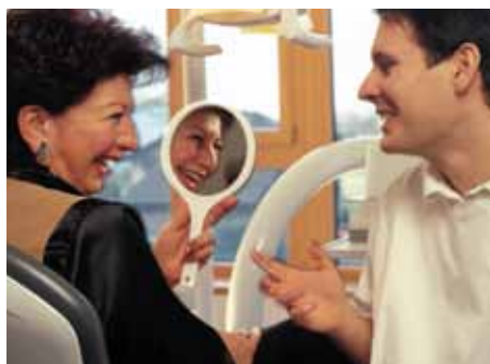
Une bouche en bonne santé pour se sentir bien.

Des études s'intéressant à divers aspects de nos produits dans les différents groupes de patients viennent en renfort de l'expérience acquise en cabinets. Pour plus de détails sur les bénéfices et conseils d'utilisation propres à chaque groupe cible, veuillez consulter les supports de documentation des différents produits.