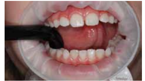
Assez d'espace pour Bluephase Style dans la bouche de l'enfant (Dr N. Bartling).