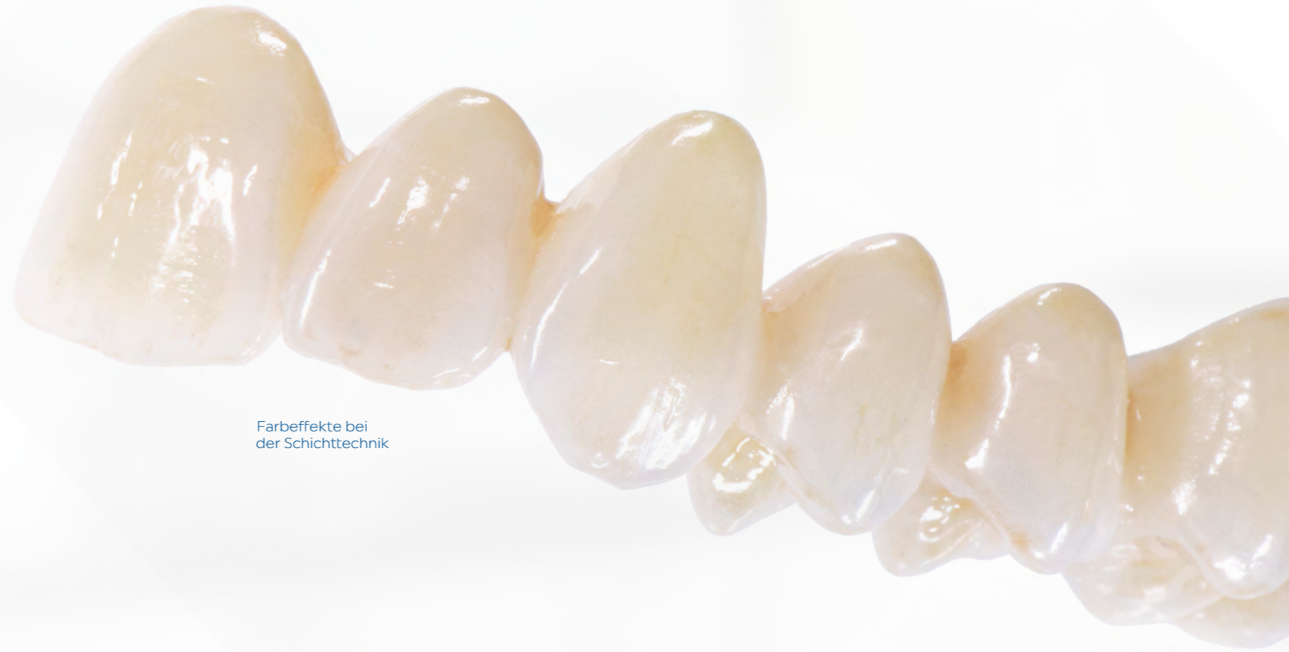
Farbeffekte bei der Schichttechnik