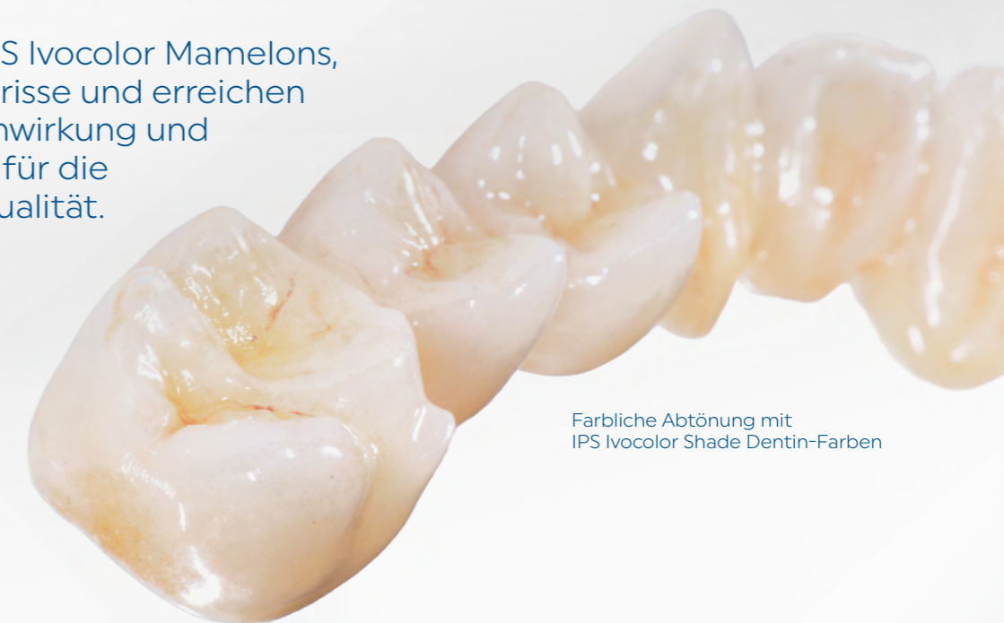
Farbliche Abtönung mit IPS Ivocolor Shade Dentin-Farben

Gestalten Sie mit IPS Ivocolor Mamelons, Halos oder Schmelzrisse und erreichen Sie natürliche Tiefenwirkung und inzisale Transluzenz für die gewünschte Individualität.