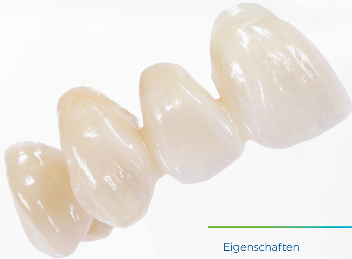
Farbeffekte bei der Schichttechnik

Dank unserer bewährten Gelstruktur bieten sie eine einfache Applikation und einen homogenen Farbauftrag. Besonders geeignet sind sie für die Bemalung monolithischer Restaurationen.