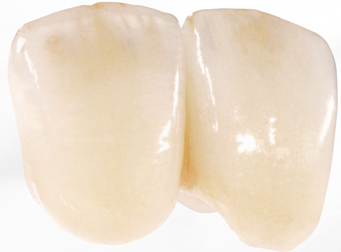
IPS Ivocolor Shade Incisals für den Schmelzbereich

Gestalten Sie mit IPS Ivocolor Mamelons, Halos oder Schmelzrisse und erreichen Sie natürliche Tiefenwirkung und inzisale Transluzenz für die gewünschte Individualität.