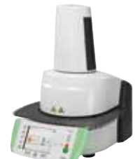
Programat EP 5000/G2