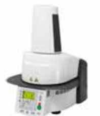
Programat EP 3000/G2