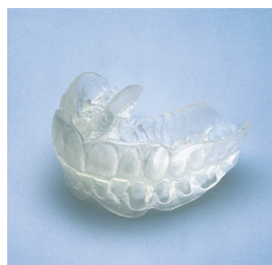
Beispiele für fertige Arbeiten