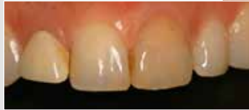
Kleines Bild: Insuffiziente Metallkeramik-Krone und verfärbte Frontzähne

Mit einer Krone stellt der Zahnarzt auch stark zerstörte Zähne wieder her. Kronen aus IPS Empress CAD passen sich optisch den Nachbarzähnen an.