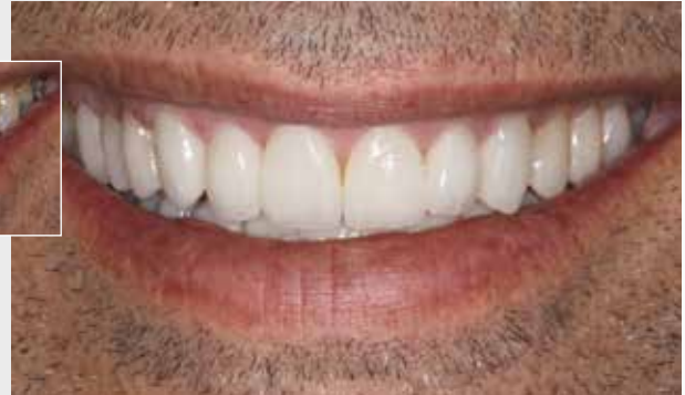
Grosses Bild: Die ästhetisch hochwertige Alternative mit Veneers aus IPS Empress® CAD