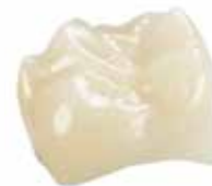
Krone aus IPS Empress® CAD