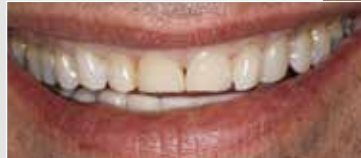
Kleines Bild: Verfärbte und abgenutzte Frontzähne

Abgebrochene oder verfärbte Zähne können mit natürlich aussehenden Veneers (Schalen) versorgt werden. Auch für solche kosmetischen Verschönerungen eignet sich IPS Empress CAD ideal.