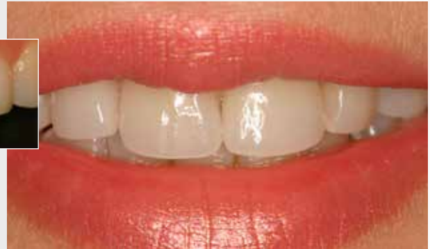
Grosses Bild: Die ästhetisch hochwertige Alternative mit Kronen aus IPS Empress® CAD