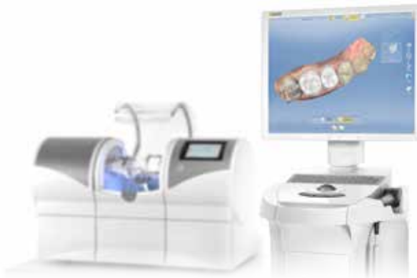
Der Keramikblock wird in der CEREC®-Maschine formgeschliffen.