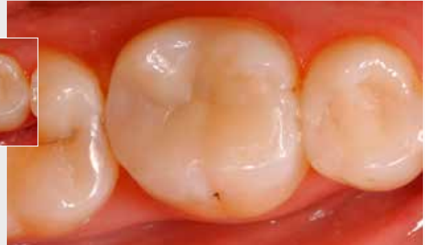
Grosses Bild: Die ästhetisch hochwertige Alternative mit einem Inlay aus IPS Empress® CAD

Dr. A. Peschke, Ivoclar Vivadent, Liechtenstein