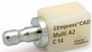
IPS Empress® CAD-Keramikblock

Die Keramikblöcke aus leuzitverstärkter Glaskeramik werden mit der innovativen CAD/CAM-Verarbeitungstechnik im CEREC®-Gerät bearbeitet.