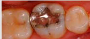
Kleines Bild: Mit Amalgam versorgter Seitenzahn

Heutzutage gibt es ästhetische Alternativen zur häufig verwendeten Amalgamfüllung. Eine Restauration aus IPS Empress CAD erkennt niemand, ausser Ihrem Zahnarzt.