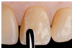
Modelado y contorneado con espátula de metal