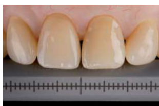
Escala de referencia 1