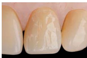
Resultado alcanzado con espátula de metal