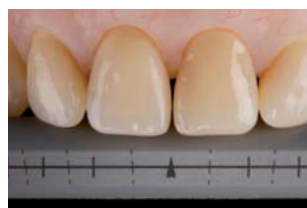
Escala de referencia 2