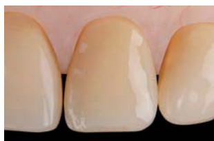
Resultado alcanzado con OptraSculpt Pad

Las almohadillas antiadherentes de OptraSculpt Pad, permiten que el composite sea contorneado y modelado con suma facilidad, sin dejar marcas no deseadas. Las obturaciones con superficies homogéneas y suaves se crean con la mayor eficiencia.