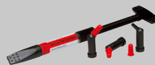
テトリック N-セラム シリンジ(3.5g) 3,200円 ▶ 1,600円