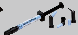
テトリック N-フロー シリンジ(2g) 2,200円 ▶ 1,100円